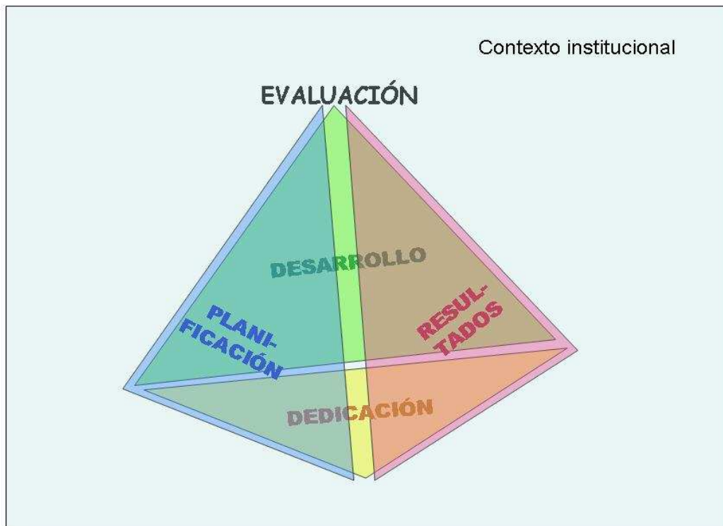
Figura 3: dimensións de avaliación da actividade docente.

O modelo en que se fundamenta este programa considera tres dimensiones como obxecto de avaliación da actividade docente: a planificación da docencia, o desenvolvemento do ensino e os resultados. Estas tres dimensións teñen como transversalidade a dedicación docente que actuaría como unha dimensión cero ou condición previa, de modo que se o profesorado non desenvolve as actuacións que a describen non procedería determinar a súa calidade.