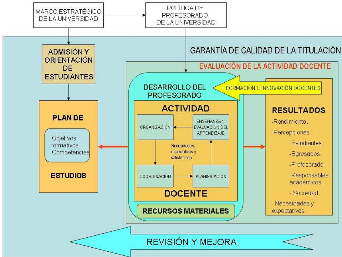
Fig. 2: plano de estudios e actividade docente

Os resultados da actividade docente 5 tradúcense en termos dos avances logrados na aprendizaxe dos estudantes e na valoración expresada en forma de percepción ou opinións do estudiantado, dos egresados, dos responsables académicos e do propio profesorado.