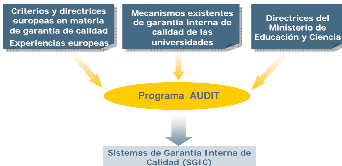
Figura 3: elementos que interactúan no programa AUDIT

Como se recolle na figura 3, na elaboración do programa AUDIT consideráronse os sistemas de garantía de calidade presentes na actualidade nas universidades españolas, derivados en boa medida dos programas de avaliación orientados á mellora, realizados na última década, así como as directrices do Ministerio de Educación e Ciencia, os criterios e as directrices europeas sobre a garantía de calidade e sobre as experiencias das universidades europeas neste ámbito.